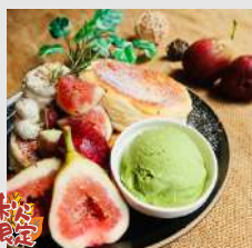
いちじく&カスタードクリ ムの秋のスフレパンケー キ