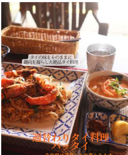
タイの味をそのままに 趣向を凝らした絶品タイ料理

2022年6月に五個荘の住宅街に猫好きなご夫婦がオープンしたごはんや。店内はアットホームな作りで老若男女誰でも気軽に寛げる雰囲気です。小上がり席は小さなお子様がいても安心できると好評です。本格的なスパイスが効いた(辛い)本日のスパイスカレーをはじめ、期間限定パスタやからあげなどの料理をゆったり堪能できます。