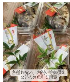
各種お祝い、内祝い等御供え などのお魚もご用意