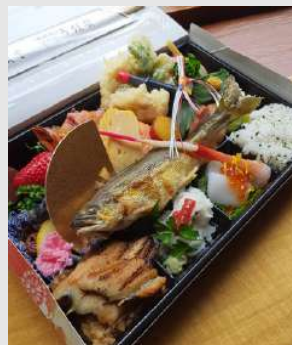
アソートボックス敬老の日2,700yen ※写真はイメージです