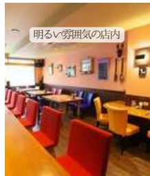
明るい雰囲気店内