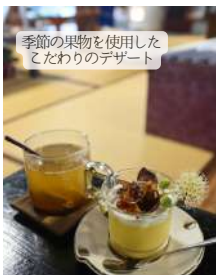
季節の果物を使用した てたわりのデザート