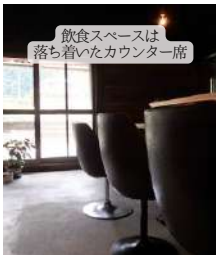
飲食スペースは 落ち着いたカウンター席