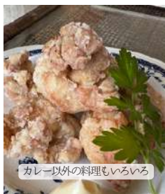
カレー以外の料理もいろいろ