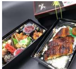
うなぎと御料理の豪華弁当 うなぎ重二段弁当2,800円