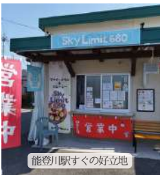
能登川駅すぐの好立地