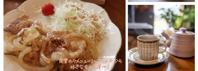
日替わりメニュー2~3つの中から好きなものを選べる