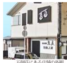
五個荘にある店舗の外観