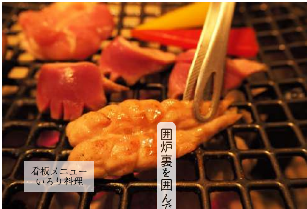
看板メニュー いろいろ料理