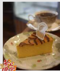
カボチャのバイクド チーズケーキ