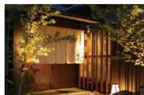
和の雰囲気漂う外観