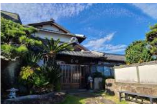
万葉ゆかりの地“蒲生野”に構える店舗

多種多様な食材が入った 二段幕の内弁当3,240円 ※ご予算に応じます ※内容は仕入れ状況により異なります