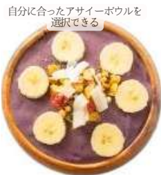
自分に合ったアサイーボウルを選べる