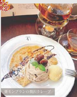
栗モンブランの贅沢クレープ

滑らかな栗のモンブランクリームと冷たいバニラアイスが、もちもちのクレープに絶妙にマッチ。さらに、香ばしく炒ったアーモンドスライスがアクセントとなり、食感の変化も楽しめます。