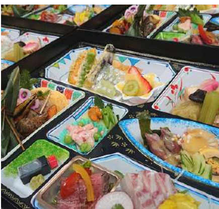
様々な料理が入った 箱会席御膳 3,300円

創業二百余年の歴史を持つ糺屋。塩糺、醤油糺、糺味噌を料理の随所に使用し上品な味わいに仕立てています。季節へ思いを馳せ、四季の美しさや味わいを一皿一皿に表現。地元滋賀の食材を厳選し、地産地消をモットーにしています。ご予算に応じてコース内容や量の変更も可能なので、お気軽にご相談ください。