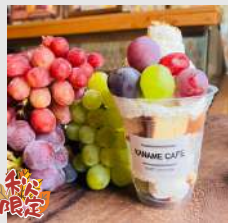
ぶどう&ごろごろ パンケーキパフェ