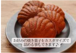
お好みの焼き菓子をカスタマイズで詰める事もできます♪