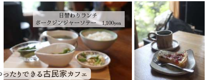
日替わりランチ ポークジンジャーソーテー 1,100yen

塩蔵を改造して作られた空間でゆったり過ごせるカフェです。笑顔が素敵な楽しいオーナーさんが切り盛りされています。日替わりランチは2-3種あり何回行っても違うものが食べられるのが人気のポイント。日替わりランチの内容は営業日のインスタグラムのストーリーから確認することができます。