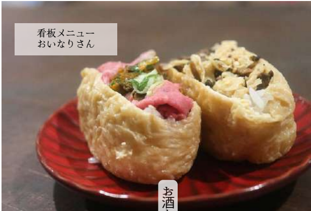
看板メニュー おいなりさん

2024年1月に店舗の場所を隣に移し席数を増やしてリニューアルオープン。お昼は週替わりランチに夜はお酒とアテが人気のお店。看板メニューのおいなりさんは特におすすめです。カウンター6席と2名掛けのテーブルが2つあり、お一人様からでも気軽に訪れることができます。