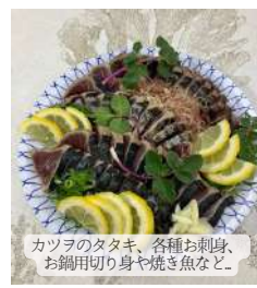
カツラのタタキ、各種お刺身、 お鍋用切り身や焼き魚など。