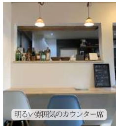
明るく雰囲気の良いカウンター席