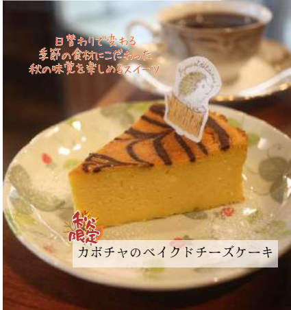
カボチャのバイクドチーズケーキ