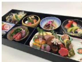
箱会席松花堂もごございます