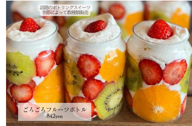
話題のボトリングスイーツ 季節によって数種類販売

同じ湖東地域にあるミモザキッチンの姉妹店。2021年11月にテイクアウト専門店としてオープンしました。オーガニックシュガーを使用した身体と環境に優しいスイーツや、無農薬野菜たっぷりのお弁当など、素材にこだわった商品を提供しています!今話題の季節の果物を使用したボトリングスイーツも販売中です♪