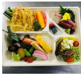
気軽に召し上がりいただける 幕の内弁当1,620円