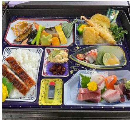
旬の食材をふんだんに使用 幕の内弁当3,240円

2代目店主が作る季節や素材にこだわった料理はどれもおいしいです。仕出しの幕の内弁当はもちろん、夜には気軽に入れる居酒屋さんへと大変身。まさに地元の人々の憩いの場所です。仕出しの幕の内弁当は1,620円から予算に応じてお作りします。