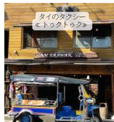
タイのタクシー <トゥクトゥク>