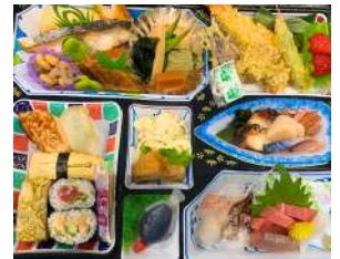
具材たっぷりのこだわり弁当 幕の内弁当5,400円