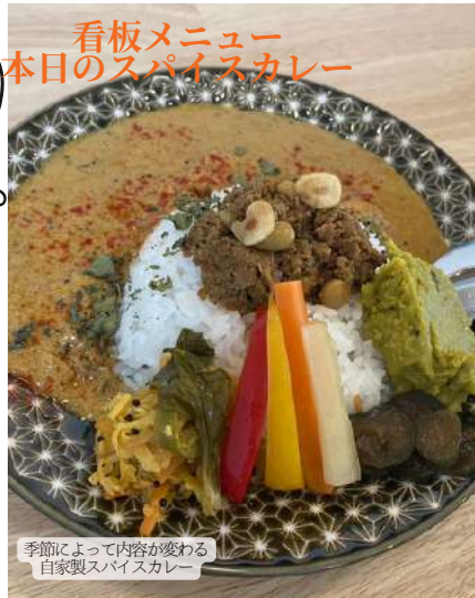
看板メニュー 本日のスパイスカレー