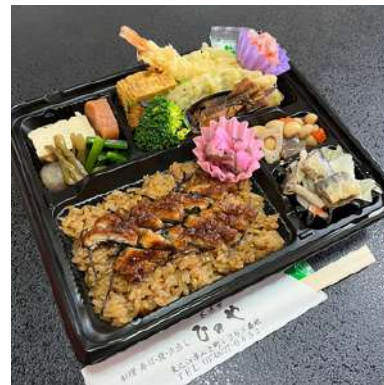
ひのや名物の鰻使用 鰻ひつまぶし弁当2,376円