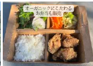
オーガニックにこだわったお弁当も販売