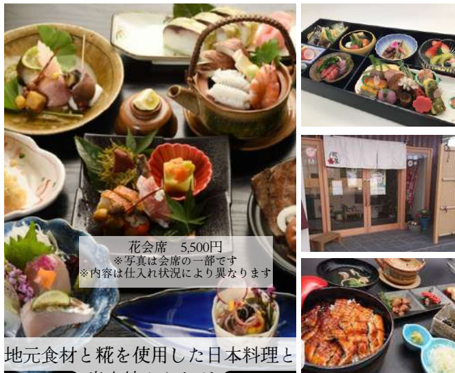
花会席 5,500円 ※写真は会席の一部です ※内容は仕入れ状況により異なります