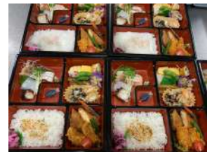
ご予算に応じて様々な幕の内弁当をお作りします