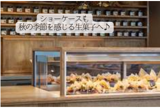
愛東産いちじくタルト