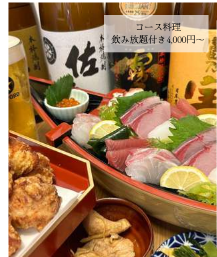
コース料理 飲み放題付き4,000円～

2023年11月にオープンした居酒屋。コース料理はもちろんのこと、市場直送のお造り盛り合わせや地元永源寺舞茸の天ぶらなど多くの料理を揃えています！1名様から気軽に飲めるカウンター席に加えて、家族や仕事仲間と利用しやすいテーブル席、さらには28名様まで入れる個室も完備。選べるおばんざいもとても人気です♪