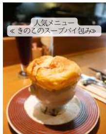
人気メニュー ◀️きのこのスープパイ包み▶️