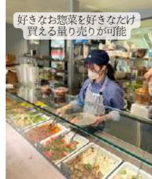
好きなお野菜を好きなだけ 買える量り売りが可能