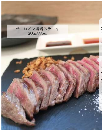
サーロイン溶岩ステーキ 200g999yen