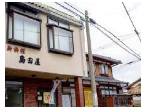
中野の住宅街に立つ歴史ある店舗