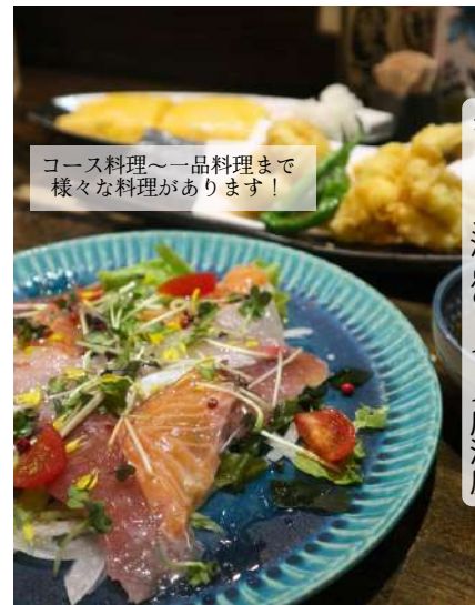
コース料理～一品料理まで 様々な料理があります！

白を基調とした店内にはカウンター席が数席とテーブル席があります。居酒屋系の一品料理からパスタやステーキなどの豪華な料理、コース料理まで世界各国いろいろな種類を取り揃えています。また平日には日替わりでお弁当をテイクアウトすることができます。また平日には日替わりでお弁当をテイクアウトすることができます。また平日には日替わりでお弁当をテイクアウトすることができます。また平日には日替わりでお弁当をテイクアウトすることができます。