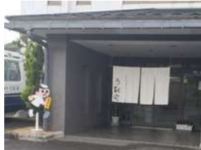
飛び出し坊やが目印の外観

秋の味覚をたっぷり使用 二段幕の内弁当4,320円 ※ご予算に応じます ※内容は仕入れ状況により異なります