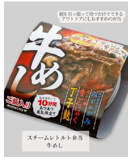
紐を引っ張って待つだけでできる アウトドアにもおすすめの弁当

近江八幡の名店『魚庄』の五箇荘工房です。店内飲食や仕出しの受け取りはできませんが、スチームレトルト弁当の受け取りができます。好きな時にいつでも食べられる!スチームレトルトお弁当シリーズは火がなくても温かいものが食べられると評判です。