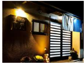
夜は地元民がふらりと立ち寄る居酒屋に