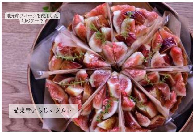
地元産フルーツを使用した旬のケーキ