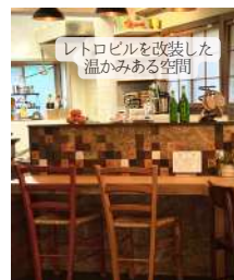
レトロビルを改装した 温かみある空間