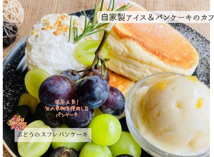
自家製アイス & パンケーキのカフェ

かなめカフェのアイスクリームは、小さなお子様に安心して食べて頂ける様に、お店で手作りしています。香料、着色料、乳化剤不使用のアイスクリームです。季節によってメニューがどんどん変わります。詳しくはインスタグラム、ホームページにてご案内させて頂いております。お家カフェなので、和室のお部屋でゆっくりとおくつろぎ下さい。