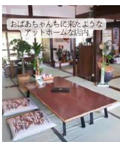
おばあちゃんにきたような アットホームな店内