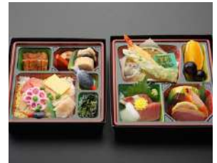
ちらし寿司入り 幕の内弁当3,240円