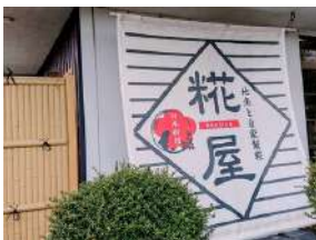
店が入った大きな店頭幕が目印です