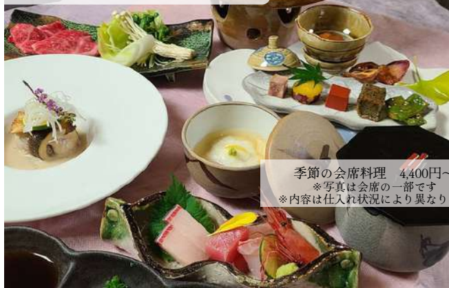
季節の会席料理 4,400円～ ※写真は会席の一部です ※内容は仕入れ状況により異なります