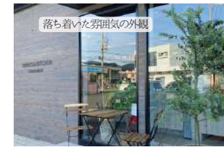
落ち着いた雰囲気の外観