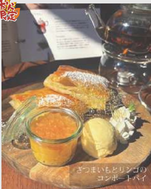
さつまいもとリンゴのコンポートパイ

ペースト状にした甘いさつまいもと程よい酸味のリンゴのコンポートが絶妙なバランスです。ふんわり焼き上げたパイ生地と一緒に楽しみください。