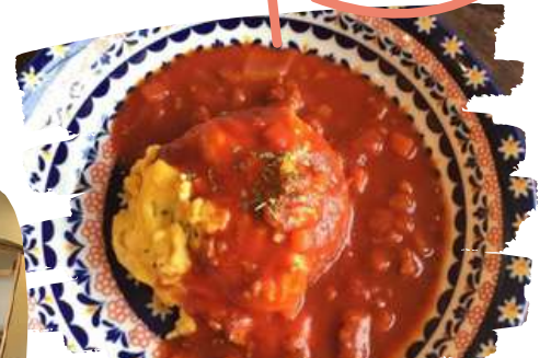
お子様ランチふわとろオムライス 単品550yen