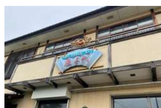
八日市駅から徒歩約6分の好立地

秋を感じるお弁当 幕の内弁当2,160円 ※ご予算に応じます ※内容は仕入れ状況により異なります