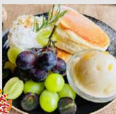
ぶどう&ヨーグルトクリ ムの秋のスフレパンケーキ

東近江市の野田ぶどう園さんのぶどうを使用したスイーツ。 どちらも好きなアイスクリームをお選びいただけます。 ※スフレパンケーキは焼き時間が約30分～かかります