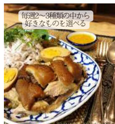
毎週2-3種類の中から 好きなものを選ぶ