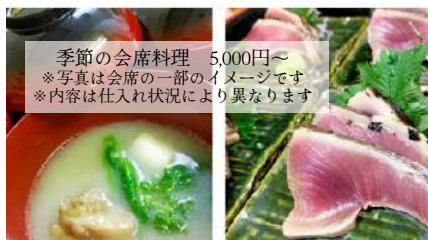
季節の会席料理 5,000円～ ※写真は会席の一部のイメージです ※内容は仕入れ状況により異なります