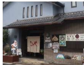
鰻を持った飛び出し坊やがお出迎え