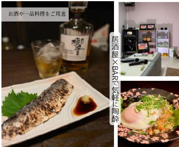
お酒や一品料理をご用意