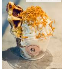
成田ふれあい牧場さんの ミルクを使用したフワフワの フレイジーソフト