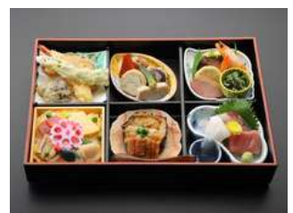
松花堂弁当もごございます