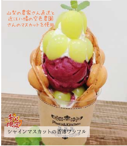
シャインマスカットの香港ワッフル