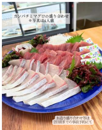
カンパチとマグロの盛り合わせ ※写真は4人前