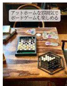
アットホームな雰囲気 でボードゲームも楽しめる

リピーターさんが多い人気メニュー トロトロ&プルプルなマトンの食感 を楽しめる一品