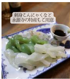
刺身こんにゃくなど 永源寺の特産も用意