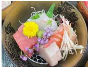
新鮮なお造りを使用

東近江市市子松井町191-2 朝日大塚駅から徒歩約17分 ☎0748-55-0439 ㊟月 ㊟約15台 11:00-14:30 / 17:00-21:00