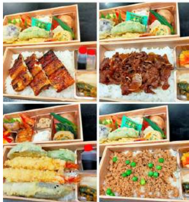
バリエーション豊富! うなぎ重弁当 3,800円